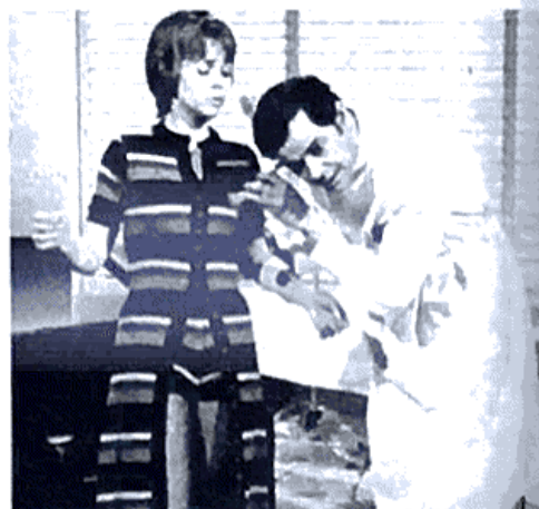
Cornelia Froboess en „dokter” Walter Giller.