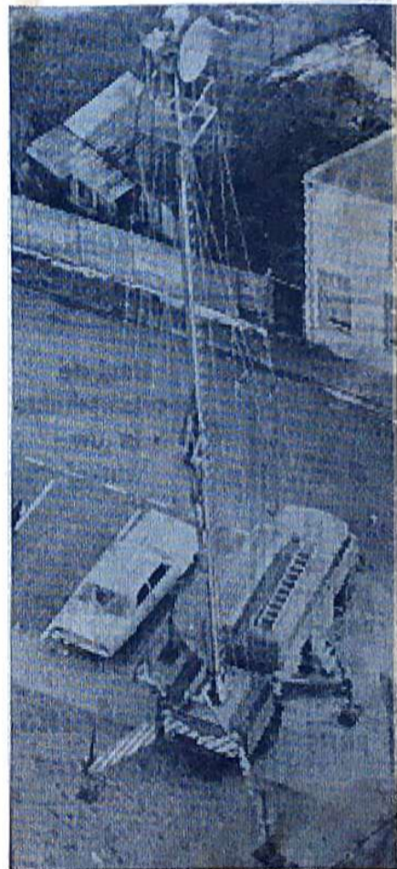
★ Via deze straalzender werden de beelden rechtstreeks in Bussum ontvangen.

Dit was slechts een kleine impressie van wat er zich j.l. zondag allemaal in de met honderden meters kabel, rijdende camera's en lichtaggregaten gevulde St. Petruskerk afspeelde. Een toen nog wat rommelige manifestatie, die echter op zondag 5 april via Nederland I „beeldschon” op het fluorescerende venster zal verschijnen.